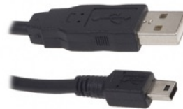
USB A et USB mini B

L'USB est plus compatible, il remplace le FireWire dans les caméscopes à mémoire.